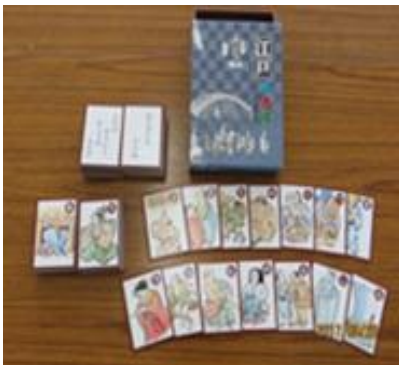
⑯江戸いろはかるた