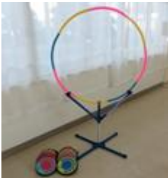
⑦フープディスクゲッター