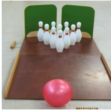
②友・遊ボウリング